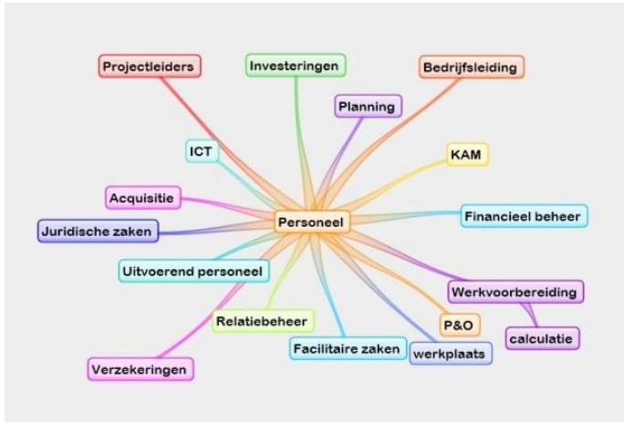
Figuur 1: Interne stakeholders

Onder interne stakeholders valt het personeel. Figuur 1 geeft een weergave van welke functies er bij Van der Meer B.V. zijn.